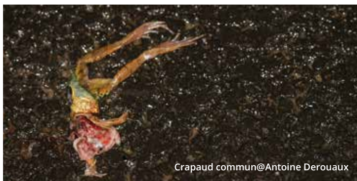
Crapaud commun