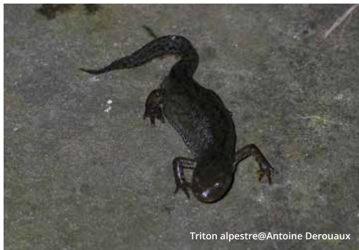
Triton alpestre

Différentes personnes et groupes sont actifs dans la région, renforçons leurs initiatives. Des citoyens, des étudiants (et leur école), des associations, des parcs naturels, des villes et communes, notamment via les PCDN, des membres et groupes locaux de Natagora (dont notre régionale) bien entendu, s'impliquent de différentes manières pour la préservation des amphibiens.