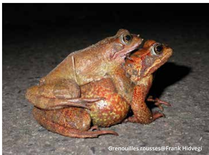
Grenouilles rousses

Comme chaque année, nous faisons appel à vous afin de vous inciter à participer aux opérations de sauvetage dans votre région. Elles ont débuté et le manque de volontaires est criant partout.